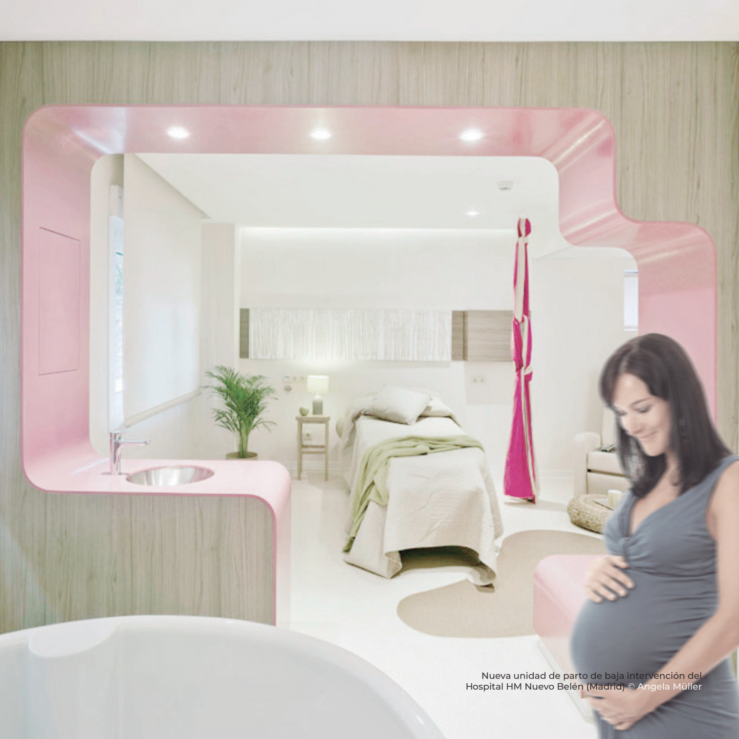
Nueva unidad de parto de baja intervención del Hospital HM Nuevo Belén (Madrid)